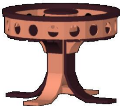
Vista plano 3D.