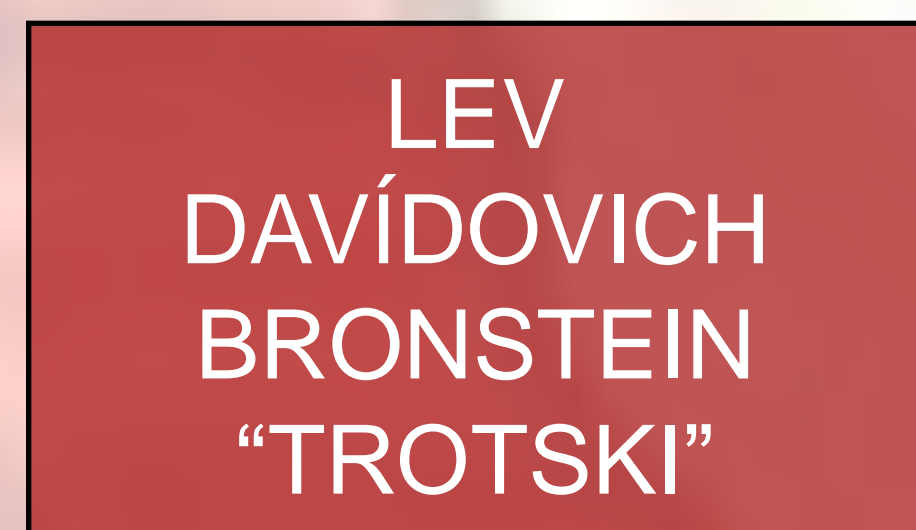
LEV DAVÍDOVICH BRONSTEIN "TROTSKI"