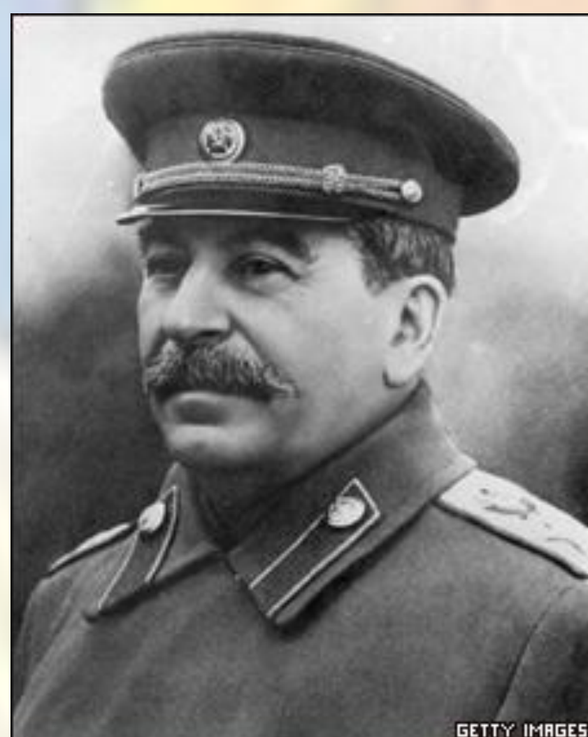
IÓSIV VISARIÓNOVICH DZHUGACHVILI "STALIN"